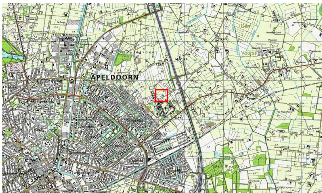
Figuur 1: Ligging plangebied (rood kader) binnen omgeving

Het bestemmingsplan Zuidbroek voorziet in het initiatief van de familie Smallegoor middels een wijzigingsbevoegdheid (artikel 3.3. lid 7 sub b van de planvoorschriften). Daarmee kunnen op de als zodanig aangewezen woonpercelen, onder voorwaarden, vrijstaande en halfvrijstaande woningen worden toegevoegd. Met toepassing van deze wijzigingsbevoegdheid is het voor de initiatiefnemers mogelijk om de extra woning te kunnen realiseren. Voor de tweede woning is de initiatiefnemer inmiddels gekomen tot een aanvraag bouwvergunning dat zowel voldoet aan de voorwaarden behorende bij de wijzigingsbevoegdheid als aan de redelijke eisen van welstand. Voor het vervangen van de gesloopte woning zal in de nabije toekomst een bouwplan worden ontwikkeld binnen de dan geldende kaders.