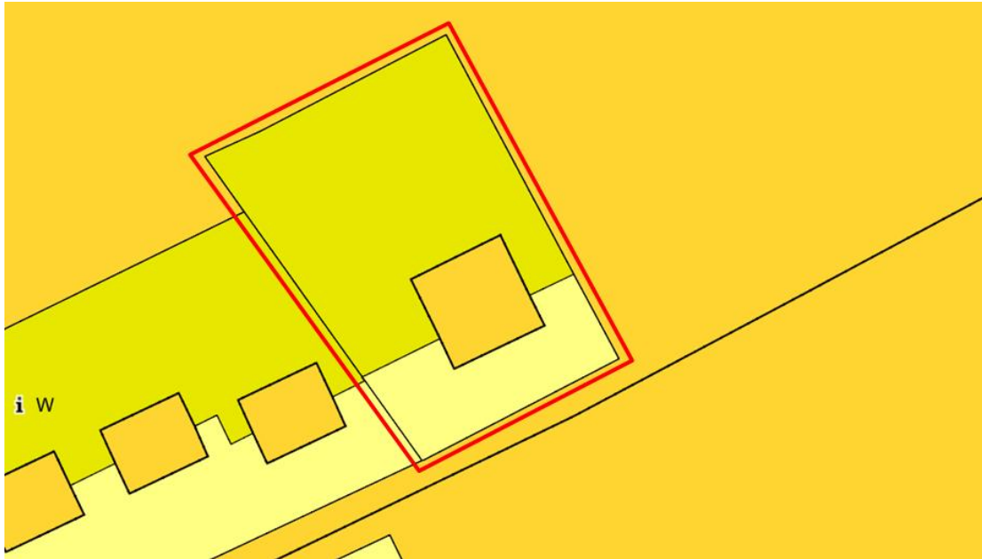
Figuur 3: uitsnede plankaart met het plangebied rood omkaderd.