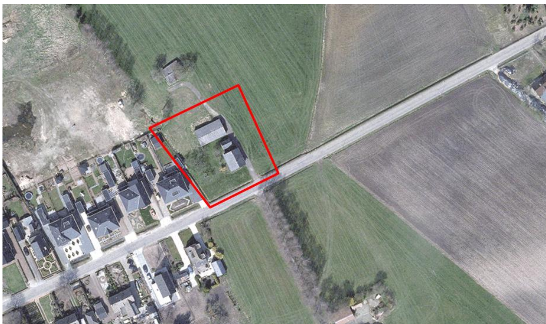
Figuur 2: Luchtfoto uit 2009 met het plangebied globaal rood omkaderd.

Conclusie: aan gestelde objectieve criteria wordt voldaan c.q. er is geen strijdigheid met de criteria.