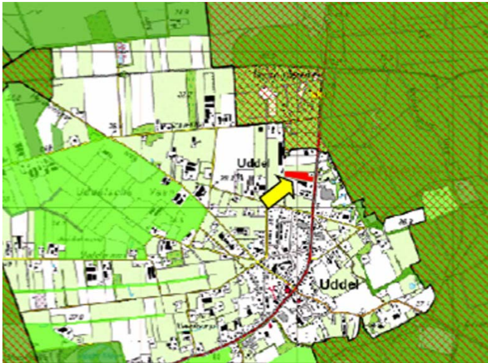
Figuur 1: Topografische ligging van de bedrijvenstrook.

De bedrijvenstrook biedt ruimte voor kantoren en lichte bedrijven in de milieucategorie 2 en 3. In de onderstaande figuur is de ligging weergegeven. Gearceerd zijn ook de Natura2000 gebieden weergegeven. Momenteel heeft het perceel een agrarische bestemming.