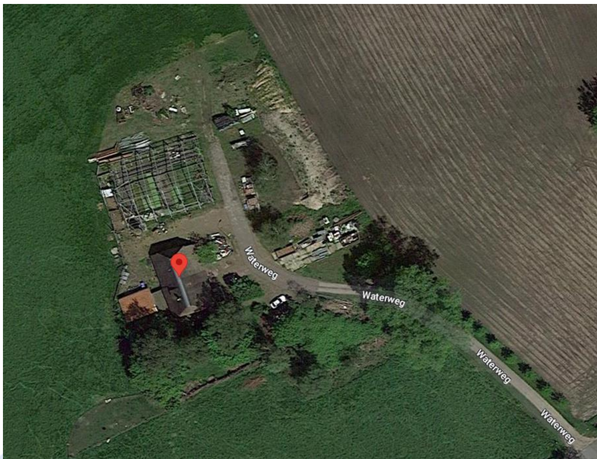
Huidige situatie/ project gebied