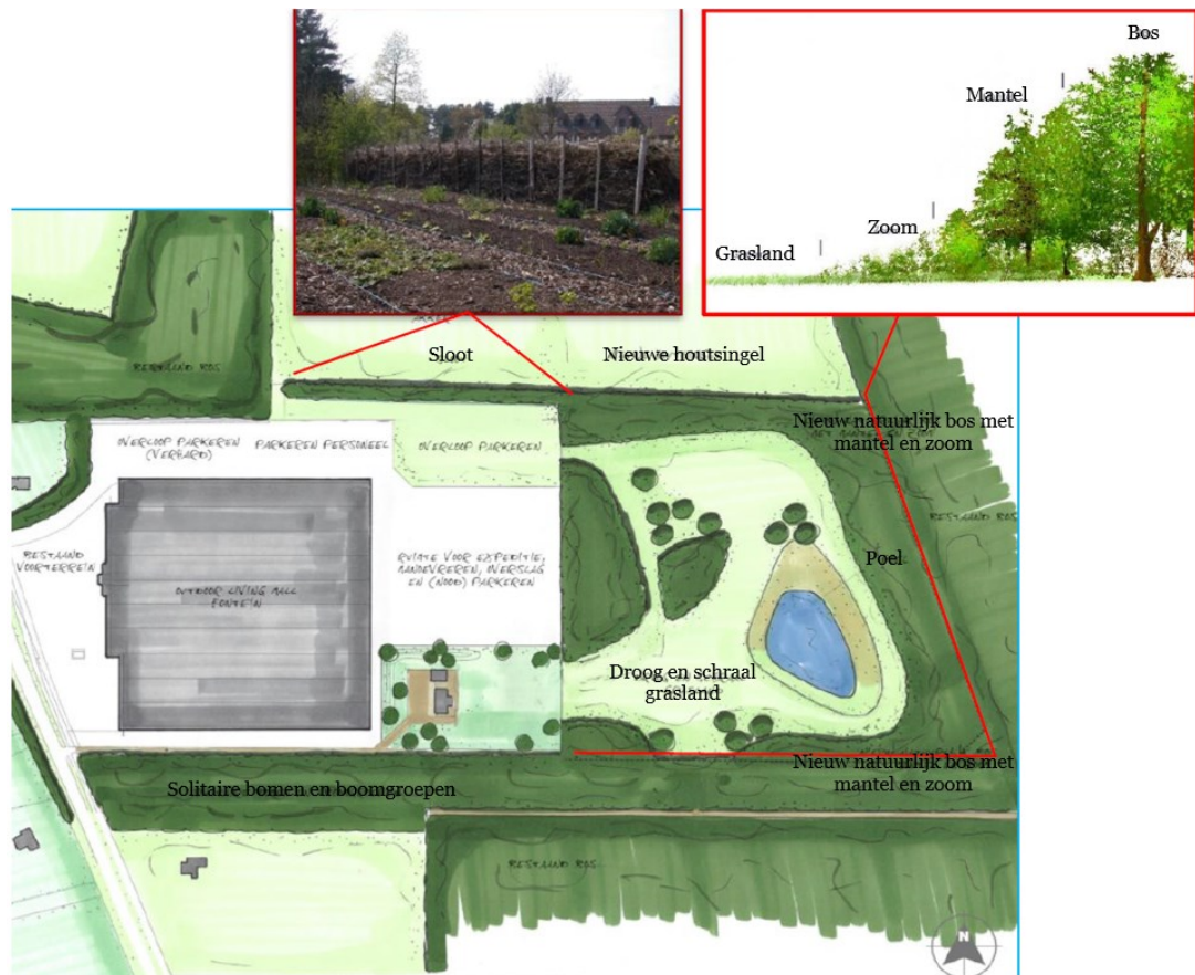
Figuur 3 Inrichting natuurgebied met onder andere een poel, een nieuwe houtsingel, droog en schraal grasland, bomen en bos.