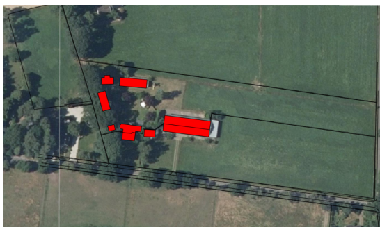
Afb. boven: situering bebouwing op een recente luchtfoto, inclusief kadastrale verkaveling.