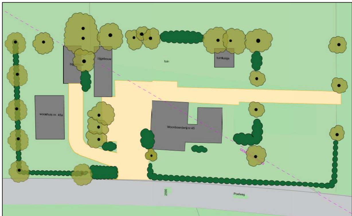
Afbeelding 2: situering beoogde situatie