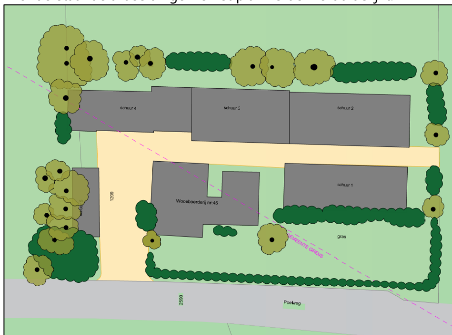
Afbeelding 1: situering huidige situatie

In onderstaande afbeeldingen is het plan verder verduidelijkt.