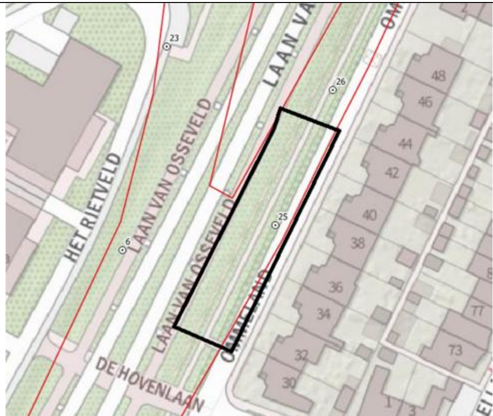
Figuur 1: Advieszone archeologische begeleiding rondom boring 25.