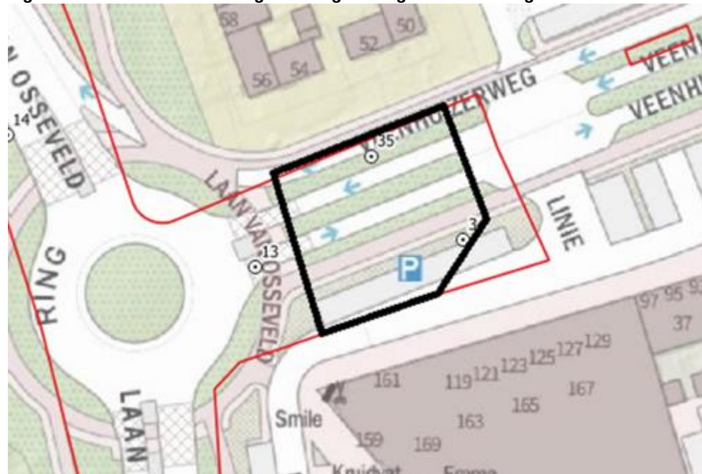
Figuur 2: Advieszone archeologische begeleiding rondom boring 35.