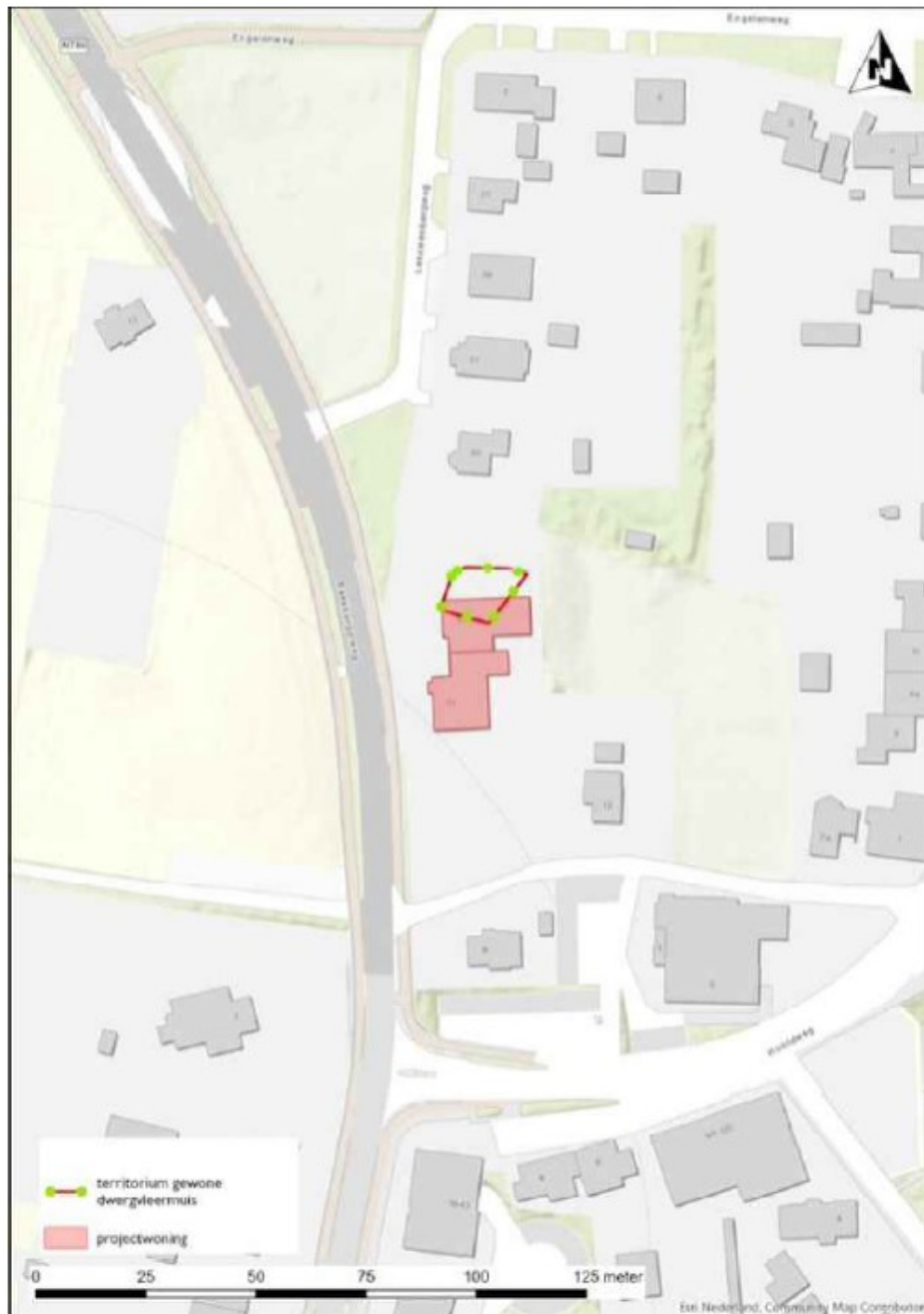
Figuur 1 Plangebied Beekbergerweg 14 en 16 te Loenen. Groene bolletjes en rode lijn; territorium paarverblijfplaats gewone dwergyleermuis.