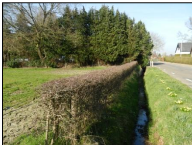
Figuur 3. Sloot en haag aan oostzijde onderzoekslocatie.