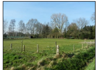
Figuur 5. Onderzoekslocatie vanaf Oude Zwolseweg.