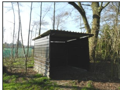
Figuur 4. schuur op noordwestelijke deel onderzoekslocatie