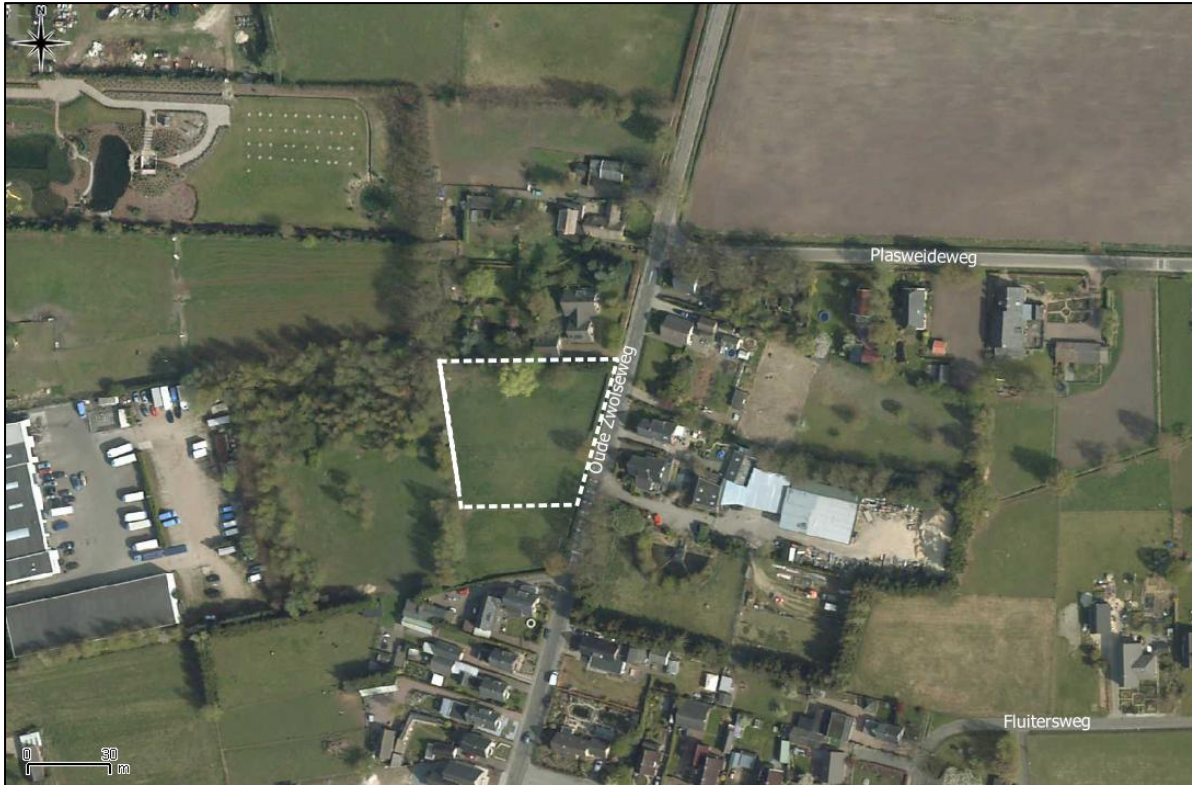
Figuur 2. Luchtfoto onderzoekslocatie en directe omgeving.