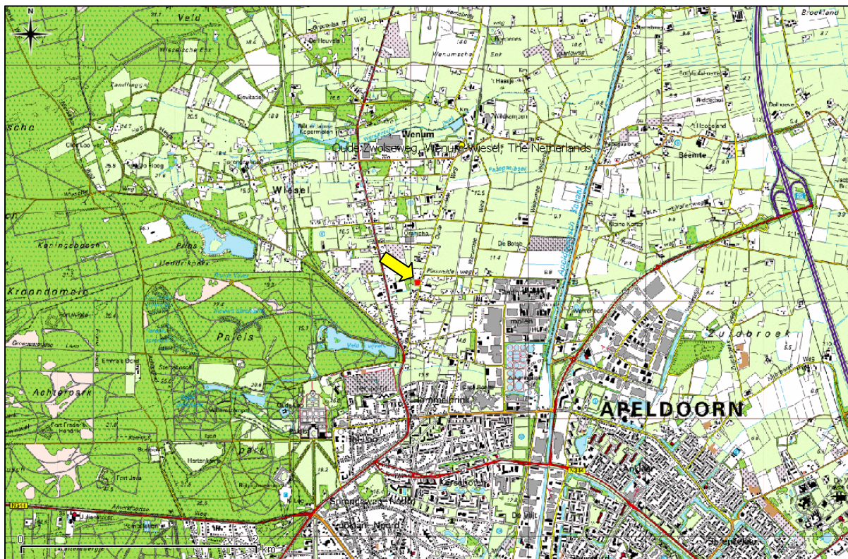
Figuur 1. Topografische ligging van de onderzoekslocatie.

Volgens de topografische kaart van Nederland, kaartblad 33 B (schaal 1:25.000), zijn de coördinaten van het midden van de onderzoekslocatie X = 194.055 , Y = 473.150 .