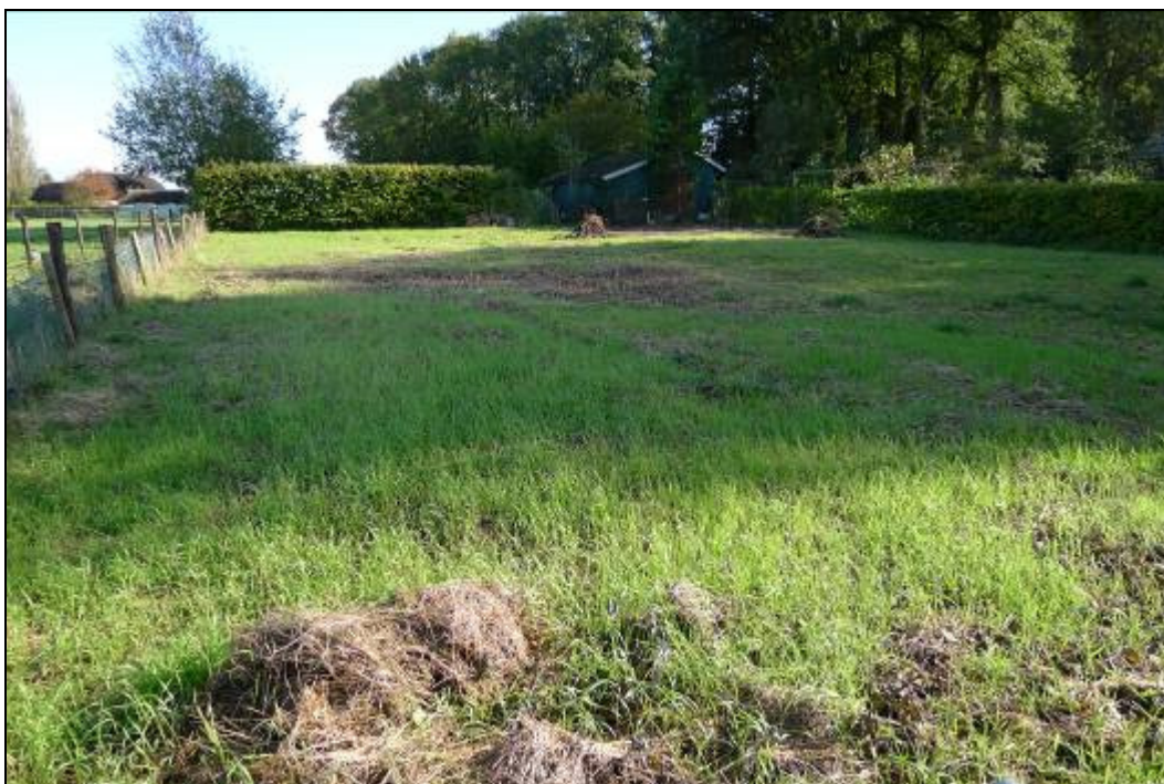
Figuur 3.2.1: Foto plangebied.

Op donderdag 20 oktober 2011 heeft een verkennend veldbezoek in het plangebied plaatsgevonden. Op basis van expert judgement is aan de hand van biotoopeisen van beschermde soorten beoordeeld welke beschermde soorten er potentieel in het plangebied voorkomen. Het veldonderzoek heeft derhalve een duidelijk verkennend karakter en kan niet worden gezien als uitputtende soorteninventarisatie.