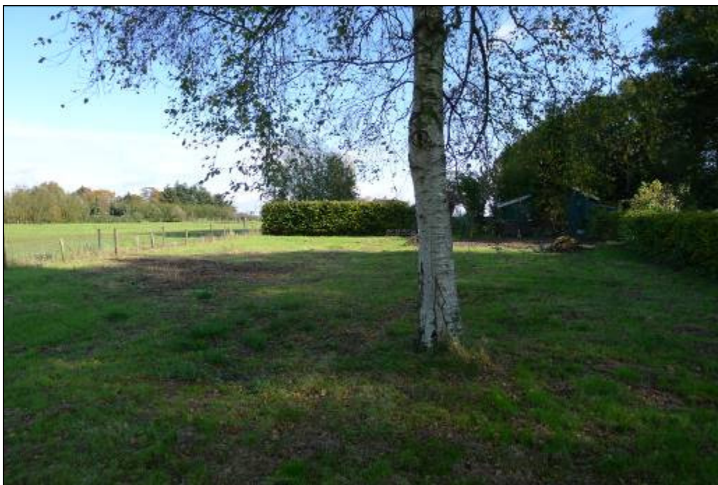
Figuur 1.2: Foto plangebied.

Het doel van dit onderzoek is om te bepalen of de geplande ontwikkelingen in het plangebied kunnen leiden tot het overtreden van verbodsbepalingen uit de wet- en regelgeving ten aanzien van natuur. Op basis van dit onderzoek kan worden vastgesteld of voor de ontwikkelingen een ontheffing in het kader van de Flora- en faunawet of een vergunning in het kader van de Natuurbeschermingswet vereist is en of in het kader van de bestemmingsplanfase een dergelijke ontheffing of vergunning verleenbaar wordt geacht.