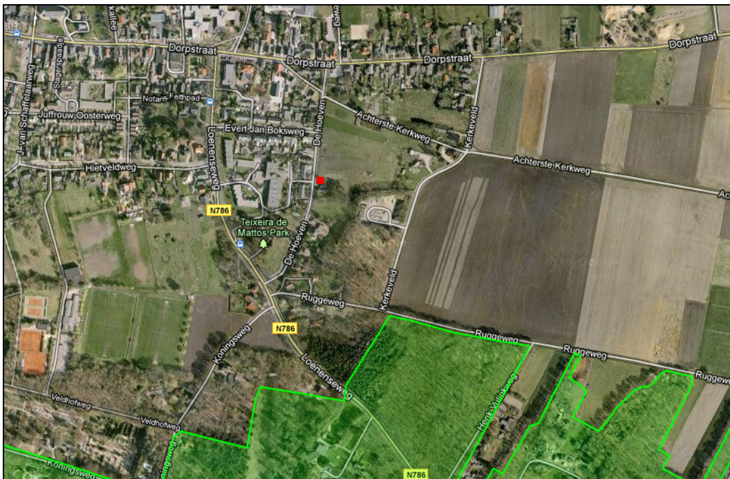
Figuur 3.1.3: Overzicht begrenzing EHS (groen gearceerd) ten opzichte van het plangebied (rode stip).

Het plangebied maakt geen onderdeel uit van de Ecologische Hoofdstructuur (EHS). Het dichtstbijzijnde EHS-gebied ligt op ca. 300m afstand van het plangebied. Aangezien het plangebied buiten de EHS ligt en gelet op de beperkte effectafstand van de ingreep, kunnen significante effecten op de wezenlijke kenmerken en waarden van de EHS worden uitgesloten. Verdere toetsing in de vorm van een “Nee, tenzij-toets” is niet aan de orde.