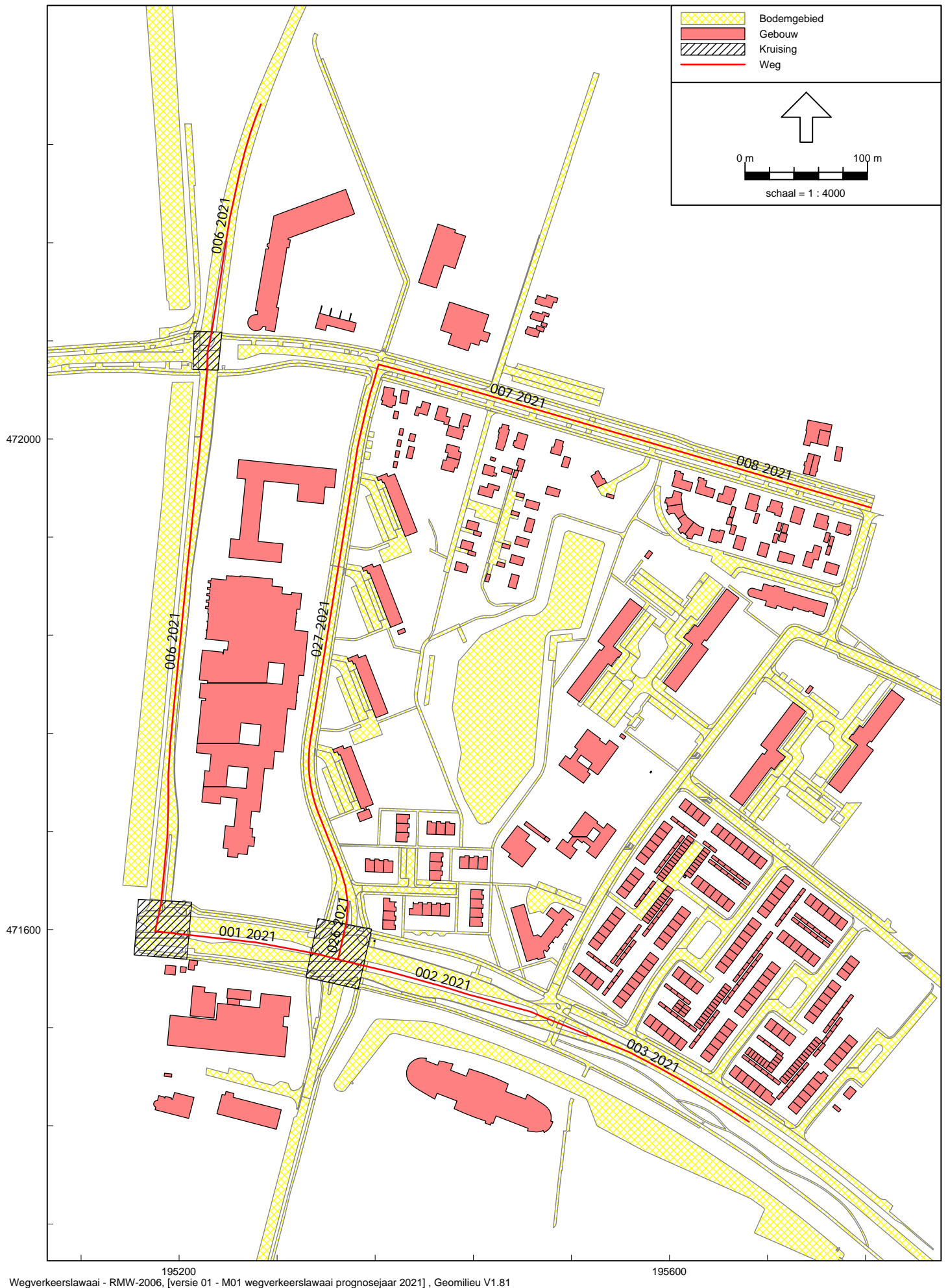
Figuur 1 Overzicht rekenmodel