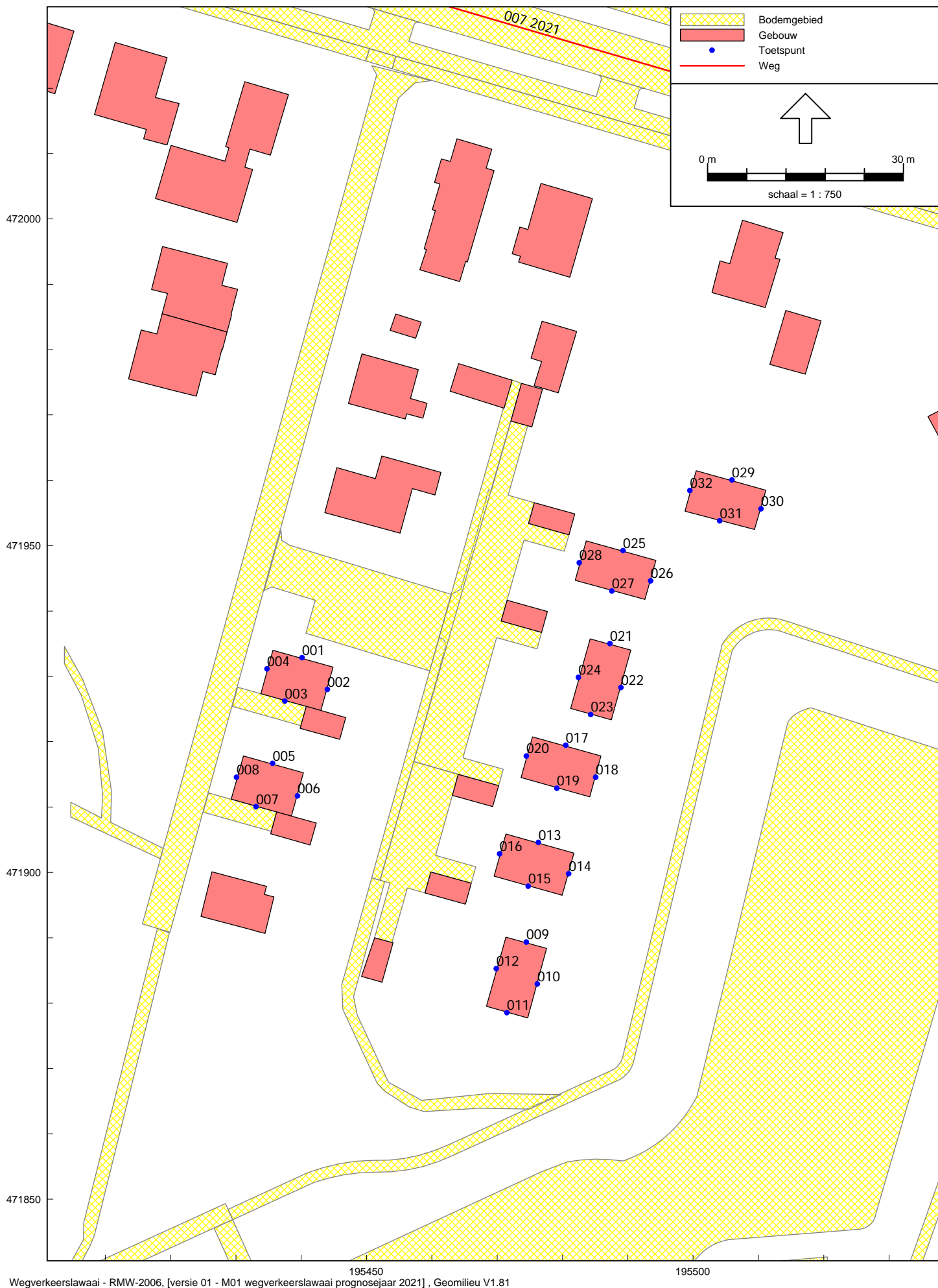
Figuur 2 Ligging beoordelingspunten