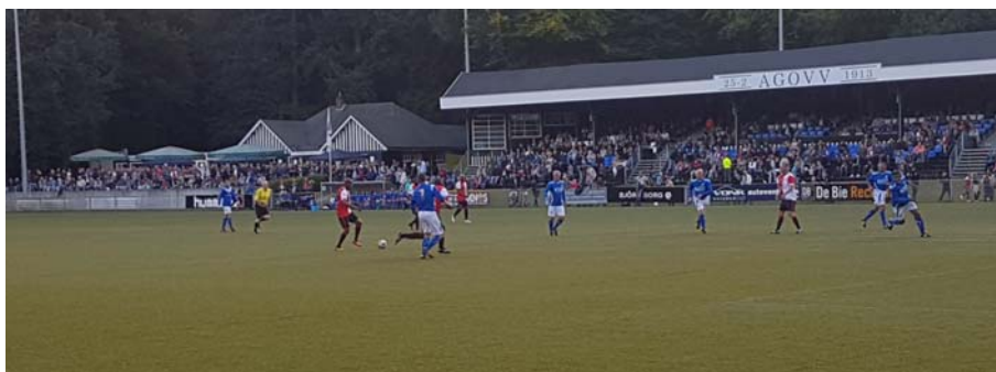
Figuur B1.1: Evenement 'Return of the legends'

Op zaterdag 2 september vanaf 19.30 uur vond bij AGOVV het evenement 'Return of the legends' plaats. Het betreft hier een wedstrijd van Oud-AGOVV tegen Oud-Feyenoord met enkele nevenactiviteiten na afloop, zoals een loterij.