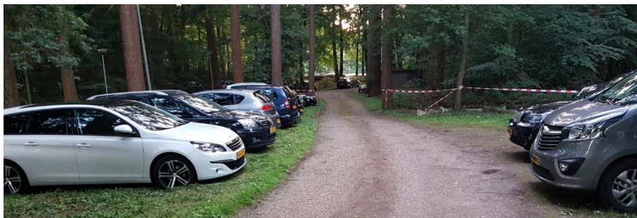
Figuur 2.2: Verspreid langs de paden in het bosgebied kunnen circa 100 auto's parkeren