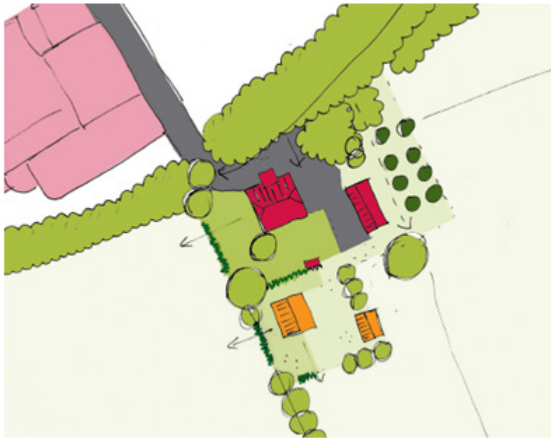
Afb.2. presentatie van de nieuwe erf opzet, na sanering van een schuur en verbouw van een bestaande schuur.