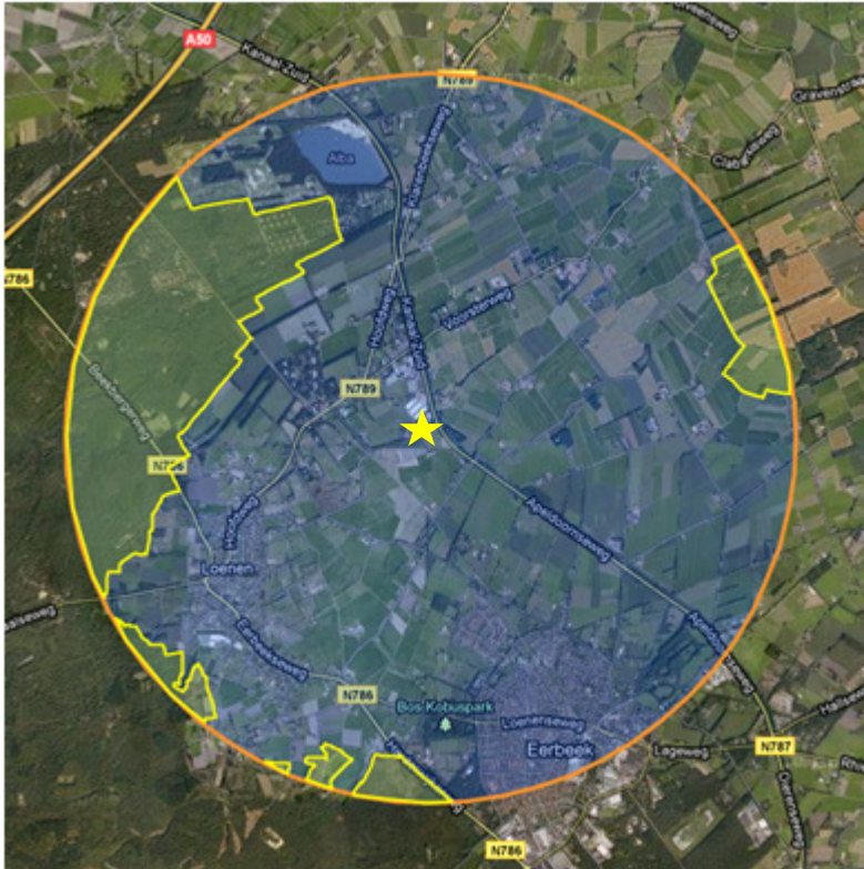
Afb. 3. De ligging van Natura2000-gebieden in een straal van 3 km rondom het studiegebied. Het studiegebied wordt aangeduid met de ster.

Er liggen twee Natura2000-gebieden in een straal van 3 km rondom het studiegebied (bron Min. EL&I 2011). Ten westen van het studiegebied ligt N2000-gebied 'Veluwe' en ten oosten van het plangebied ligt het N2000-gebied 'Landgoederen Brummen'. Het slopen van voormalige agrarische bijgebouwen en het ter plaatse bouwen van een vrijstaande woning wordt beschouwd als géén nadelig effect op de instandhoudingsdoelen voor beide N2000-gebieden.