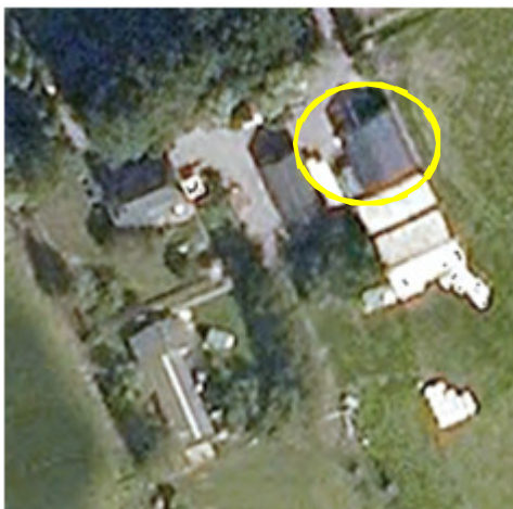
Afb. 4. Ligging van het bijgebouw waarin de Huismussennesten zijn aangetroffen. Deze locatie wordt met de gele cirkel aangeduid.

Er zijn in het studiegebied verschillende vogelnesten aangetroffen. In de meest oostelijke schuur is een oud nest van een Merel aangetroffen, een bezet nest van een Holenduif en 3 (mogelijk 4) bezette nesten van Huismussen. Opvallend genoeg zaten deze nesten vrij open en bloot tussen het dak en enkele balken. Mogelijk broedt er een Witte Kwikstaart in een ander bijgebouw. In de huidige bedrijfswoning broeden Huismussen onder de pannen.