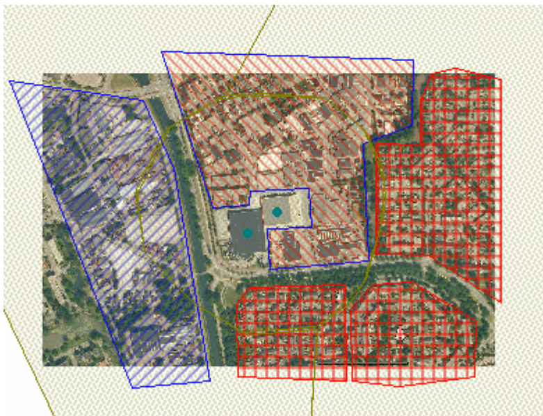
Figuur 3 bebouwingsvlakken GR berekening

Uit deze berekening blijkt dat daarbij geen sprake is van een groepsrisico (maximaal 3 slachtoffers). Dit houdt in dat personen die nabij Ter Hoeven verblijven niet leiden tot een groepsrisico conform artikel 1 Bevi. De veronderstelling van de regionale brandweer, dat personen op grotere afstand (buiten de 10^{-9} contour) tot een (significante) toename van het groepsrisico zal leiden, is daarmee onjuist. Ter illustratie is vervolgens nog een risicoberekeningen uitgevoerd met een onwaarschijnlijk hoge bevolkingsdichtheid (1000 personen/ha) buiten de 10^{-9} contour. (zie figuur 2) Zelfs deze bevolkingsaantallen leiden niet tot een groepsrisico.