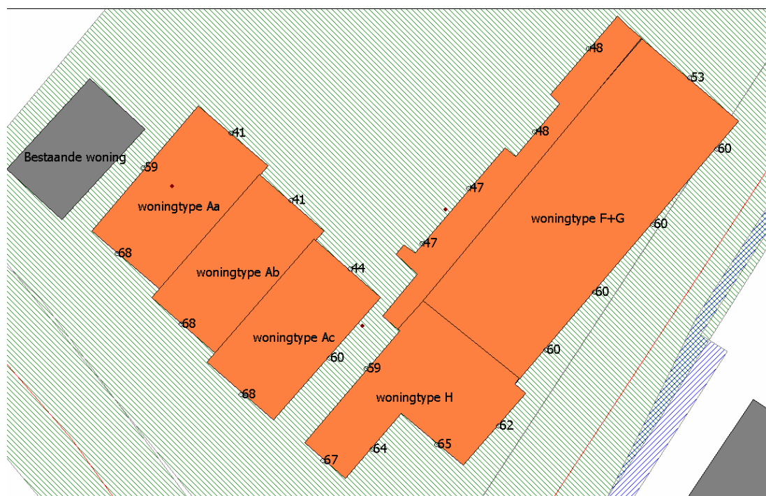
Figuur 5.5 Gecumuleerde geluidbelasting woningtypen A,H, F en G, exclusief aftrek 110g Wgh

De paragrafen 5.5 en 5.6 geven per deelgebied op de beoordeelde gevels de gecumuleerde geluidbelasting in dB weer als gevolg van de beoordeelde wegen gezamenlijk. De gepresenteerde waarden ten gevolge van de cumulatie zijn exclusief de aftrek conform artikel 110g Wgh.