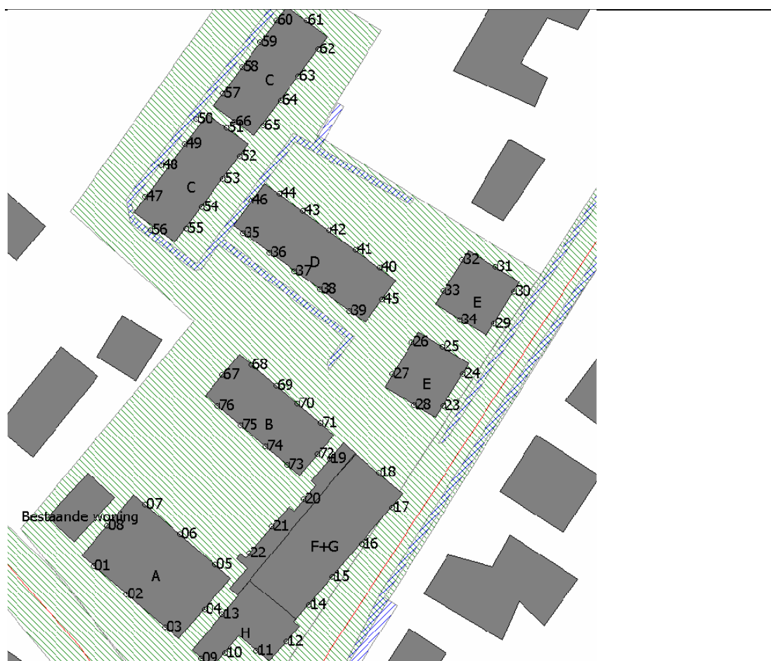
Figuur 3.1 Geplande nieuwbouw en beoordelingspunten

Figuur 3.1 geeft de geplande nieuwbouw en beoordelingspunten weer. In bijlage 1 zijn de resultaten te zien van alle beoordelingspunten op beoordelingshoogten van 1,5, 4,5 en 7,5 meter.