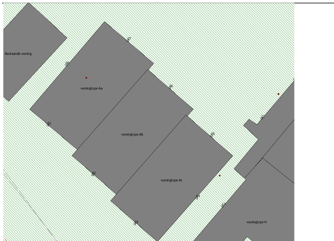
Figuur 4.1 Type A woningen minimaal 13 meter vanaf de wegas, verspringend met één meter