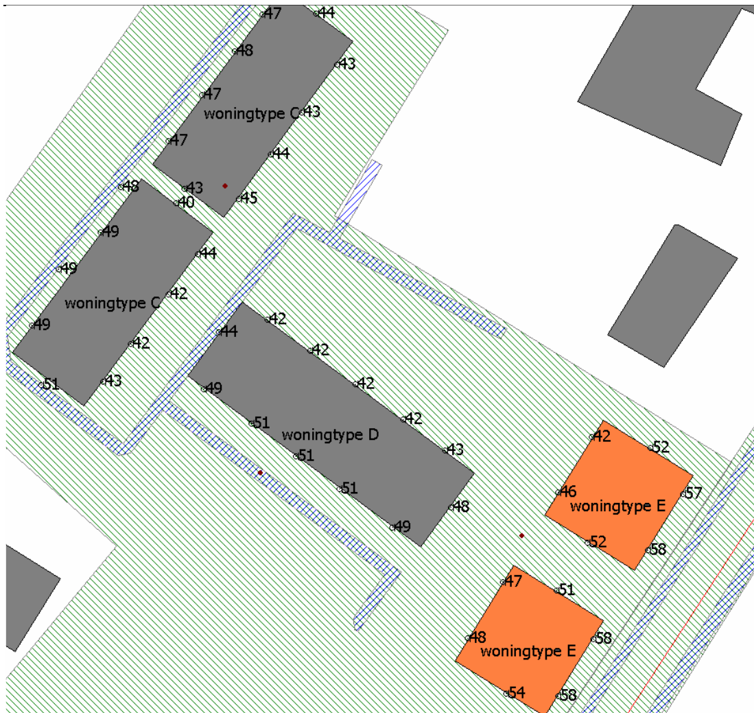
Figuur 5.6 Gecumuleerde geluidbelasting woningtypen C, D en E, exclusief aftrek 110g Wgh

Ter plaatse van de oranje gekleurde woonblokken in figuren 5.5 en 5.6 bedraagt de gecumuleerde geluidbelasting meer dan 53 dB. Voor deze woningen dient rekening te worden gehouden met aanvullende gevelweringsmaatregelen om te kunnen voldoen aan de eisen ten aanzien van het binnenniveau in het Bouwbesluit.