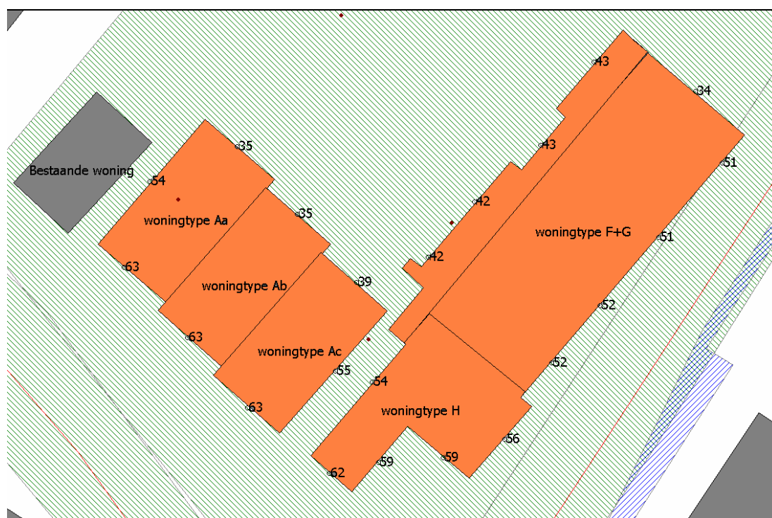
Figuur 5.1 Geluidbelasting woningtypen A,H, F en G vanwege de Eerbeekseweg, inclusief aftrek 110g Wgh

Figuren 5.1 en 5.2 geven de geluidbelasting weer als gevolg van de Eerbeekseweg. Hierbij is rekening gehouden met de aftrek conform artikel 110g van de Wet geluidhinder.